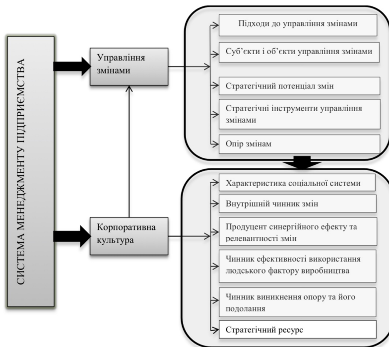
Рис.2. Зв'язок між управлінням змінами та корпоративною культурою

Корпоративну культуру в фокусі управління змінами пропонується розглядати як систему цінностей, переконань та уявлень, а також ефективних принципів, норм поведінки, традицій тощо, що склалися на підприємстві під впливом місії та філософії існування й життєвого циклу організації і визначають досягнення цілей управління змінами. Підсумовуючи, зазначимо, що метою корпоративної культури підприємства можна вважати створення сприятливих умов й формування поведінки персоналу, яка сприяє реалізації змін [9, с.93-94]. Зв'язок між управлінням змінами та корпоративною культурою подано в рис.2.