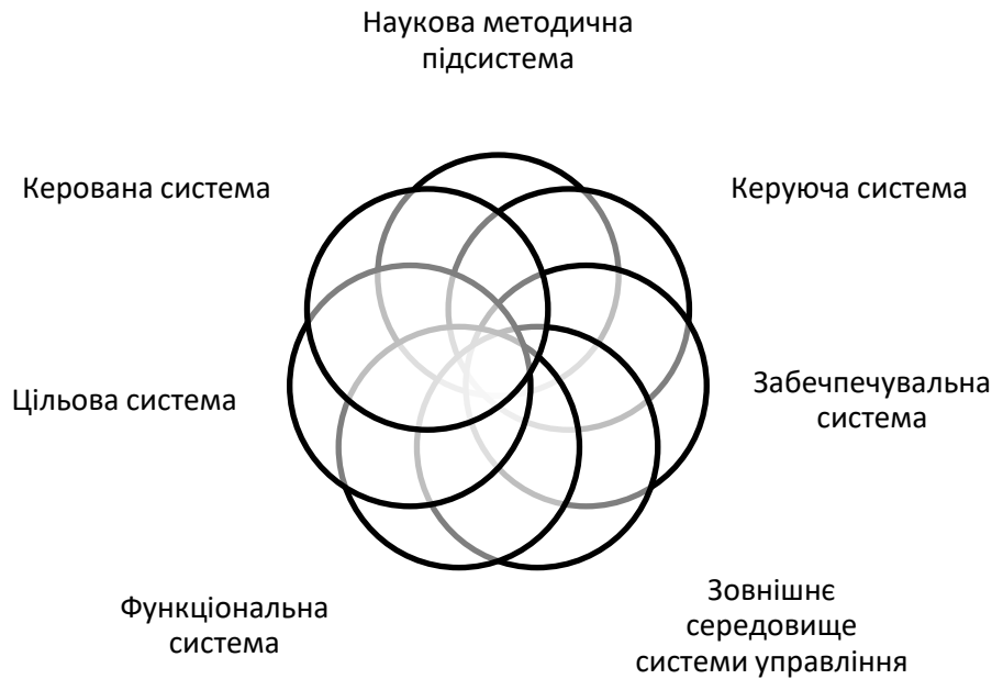
Рис.1. Структура системи управління підприємством

Побудова ефективної системи управління включає наступні її основні підсистеми (рис.1).